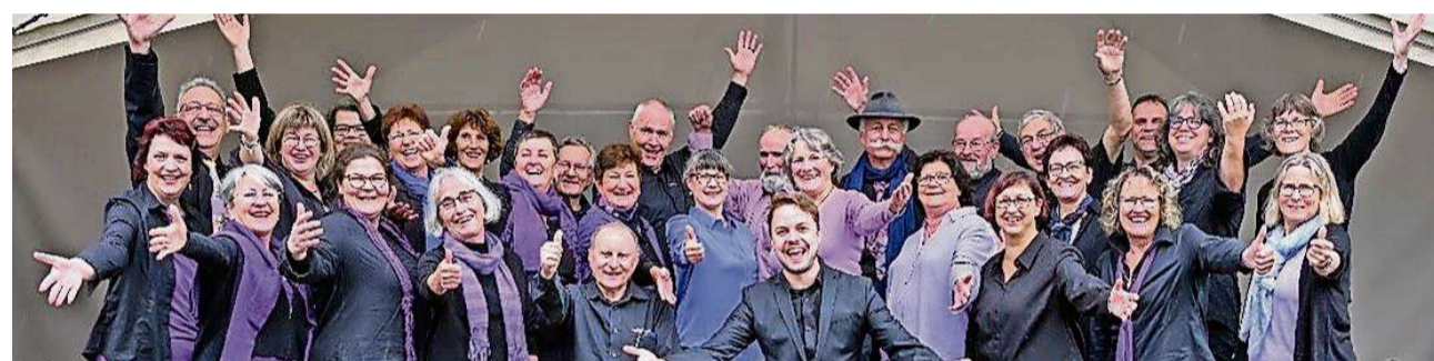
Die regioSingers sind stets auf der Suche nach neuen Sängerinnen und Sängern.