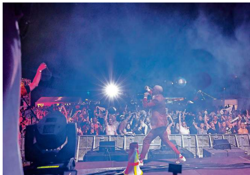
Dodo begeisterte am Sommernachtsfest.

Das Konzert endete mit einer grossartigen Zugabe, bei der Dodo das Publikum ein letztes Mal zum Ausrasten brachte. Die Lichtshow und die Soundqualität trugen ebenfalls zu einem unvergesslichen Konzerterlebnis bei. Die Konzerte von Dodo und Baba Shrimps waren ein Highlight am Sommernachtsfest und wird den Besuchern sicherlich noch lange in bester Erinnerung bleiben. pd