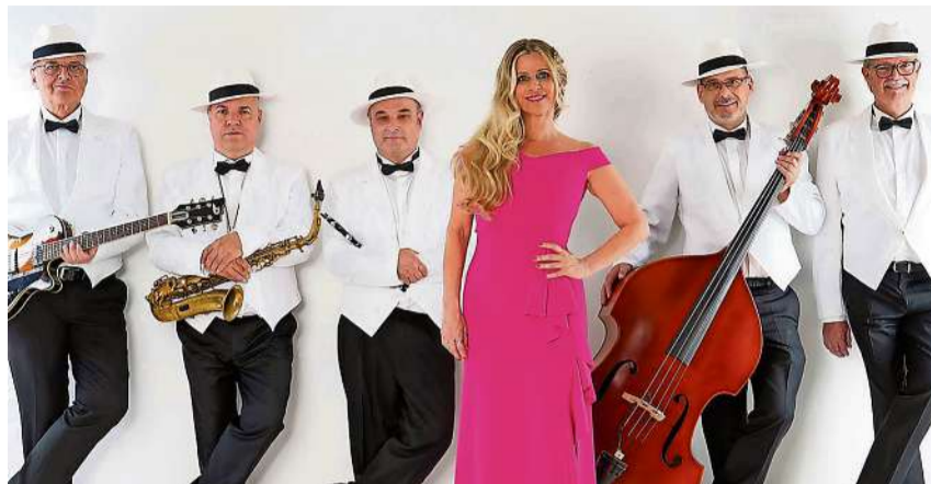
Die Santandrea Band eröffnet die diesjährige JazzMeile.