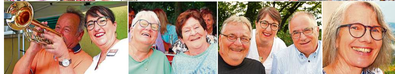
Für Sie unterwegs war Monika Meyer. Weitere Bilder finden Sie unter www.frauenfelder-nachrichten.ch/fotostrecken .