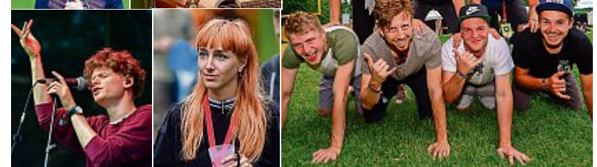
Noch mehr Bilder auf www.kreuzlinger-nachrichten.ch