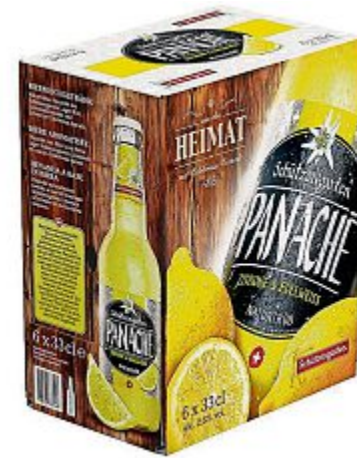
Schützengarten Panaché 6er-Pack. z.Vg.

Endlich steht der Sommer vor der Tür. Doch kein Grillfest ohne ein kühles Bier, kein Apéro ohne den passenden Wein. Damit Ostschweizerinnen und Ostschweizer nicht plötzlich ohne Getränke dastehen, führt die Brauerei Schützengarten vom 27. bis 29. Juni das traditionelle Schützengarten Getränkemarkt-Fest durch.