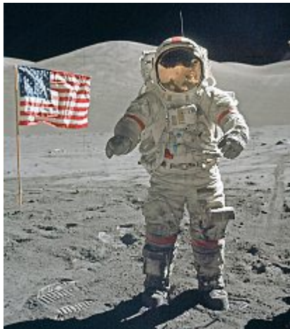
Im Juli vor 50 Jahren setzte der erste Mensch einen Fuss auf den Mond. NASA

Passend zum 50. Jahrestag der NASA-Mission «Apollo 10» eröffnet die Astronomische Vereinigung Kreuzlingen (AVK) eine kleine Wandel-Ausstellung «50 Jahre Apollo». Dies ist der Startschuss zu vielfältigen Spezialaktivitäten rund um das Thema bemannte Mondlandung im Bodensee Planetarium und Sternwarte.